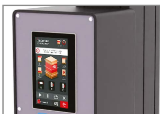
DISPLAY TOUCH SCREEN A COLORI DA 7,2" DIGITAL COLOR TOUCH SCREEN 7,2"