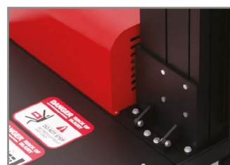
FISSAGGIO RAPIDO DELLA COLONNA FAST COLUMN ASSEMBLY