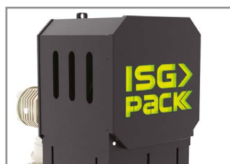
INDICATORE LUMINOSO DELLE FUNZIONI LUMINOUS SIGNAL