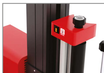
FOTOCELLULA LETTURA PALLET PHOTOCELL TO DETECT PALLET HEIGHT